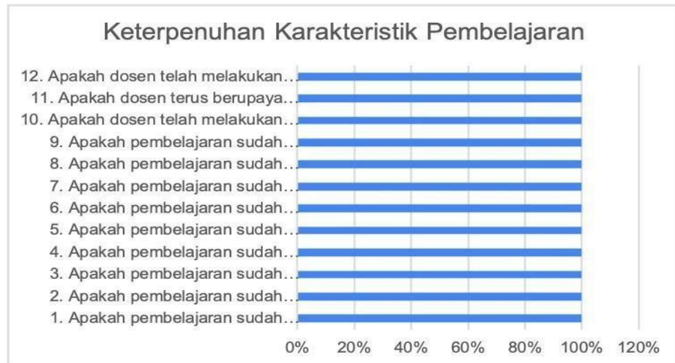
Gambar 1. Hasil Kuisisioner

Perolehan respon dosen Prodi Ekonomi Syariah Program Sarjana pada Monev keterpenuhan karakteristik pembelajarn dan integrasi penelitian dan PkM dalam pembelajaran ditunjukkan pada Gambar 1.