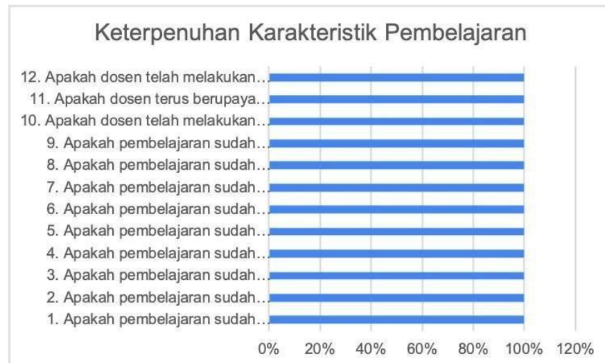
Gambar 1. Hasil Kuisisioner

Perolehan respon dosen Prodi Ekonomi Syariah Program Sarjana pada Monev keterpenuhan karakteristik pembelajarn dan integrasi penelitian dan PkM dalam pembelajaran ditunjukkan pada Gambar 1.