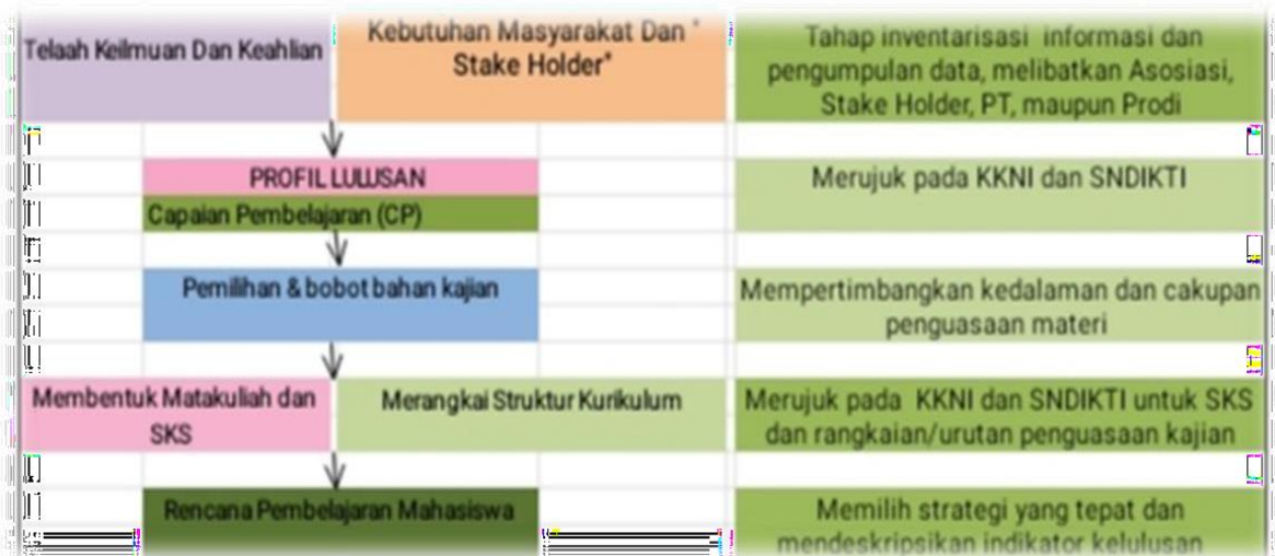
Gambar 3.1 Diagram Alur Penyusunan OBE

Tahapan penyusunan kurikulum OBE dalam diagram alur sebagai berikut: