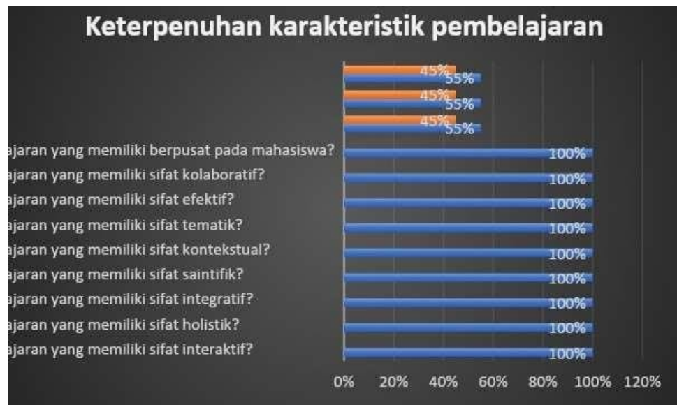
Gambar 1. Hasil Kuisisioner

Perolehan respon dosen Prodi S1 Teknik Informatika pada Monev keterpenuhan karakteristik pembelajaran dan integrasi penelitian dan PkM dalam pembelajaran ditunjukkan pada Gambar 1.