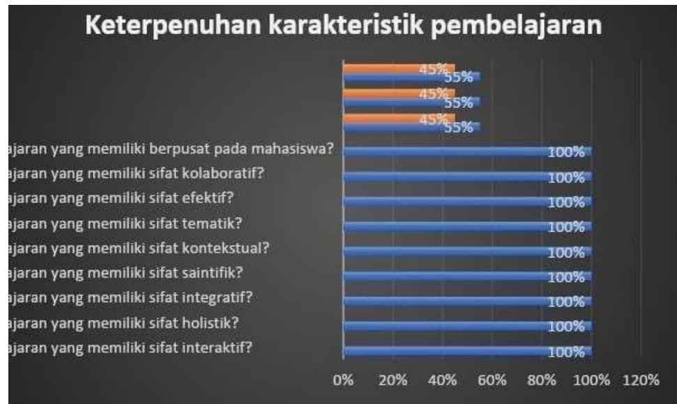
Gambar 1. Hasil Kuisisioner

Perolehan respon dosen Prodi Kebidanan Program Sarjana pada Monev keterpenuhan karakteristik pembelajaran dan integrasi penelitian dan PkM dalam pembelajaran ditunjukkan pada Gambar 1.