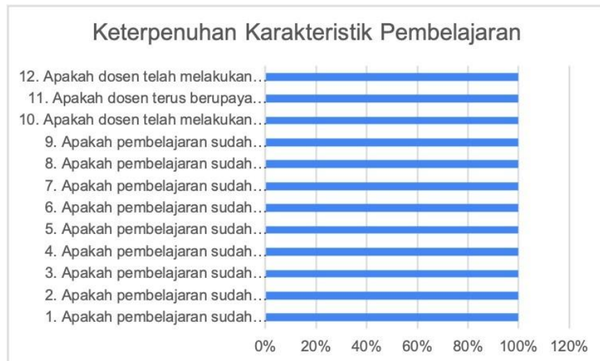
Gambar 1. Hasil Kuisisioner

Perolehan respon dosen Prodi Kebidanan Program Sarjana pada Monev keterpenuhan karakteristik pembelajarn dan integrasi penelitian dan PkM dalam pembelajaran ditunjukkan pada Gambar 1.