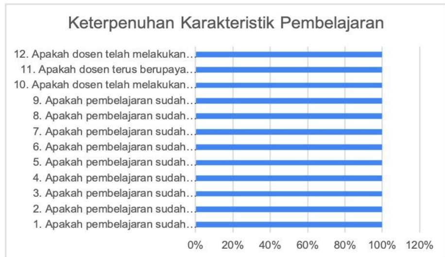
Gambar 1. Hasil Kuisisioner

Perolehan respon dosen Prodi S1 PGSD pada Monev keterpenuhan karakteristik pembelajarn dan integrasi penelitian dan PkM dalam pembelajaran ditunjukkan pada Gambar 1.